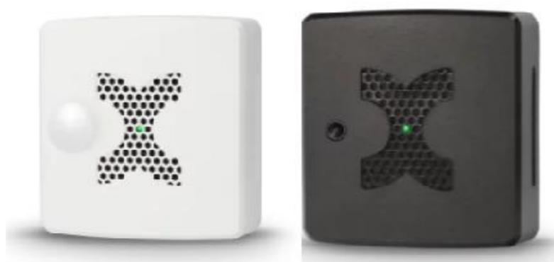
Thermo-Decken-Sensor in Weiß oder Schwarz.