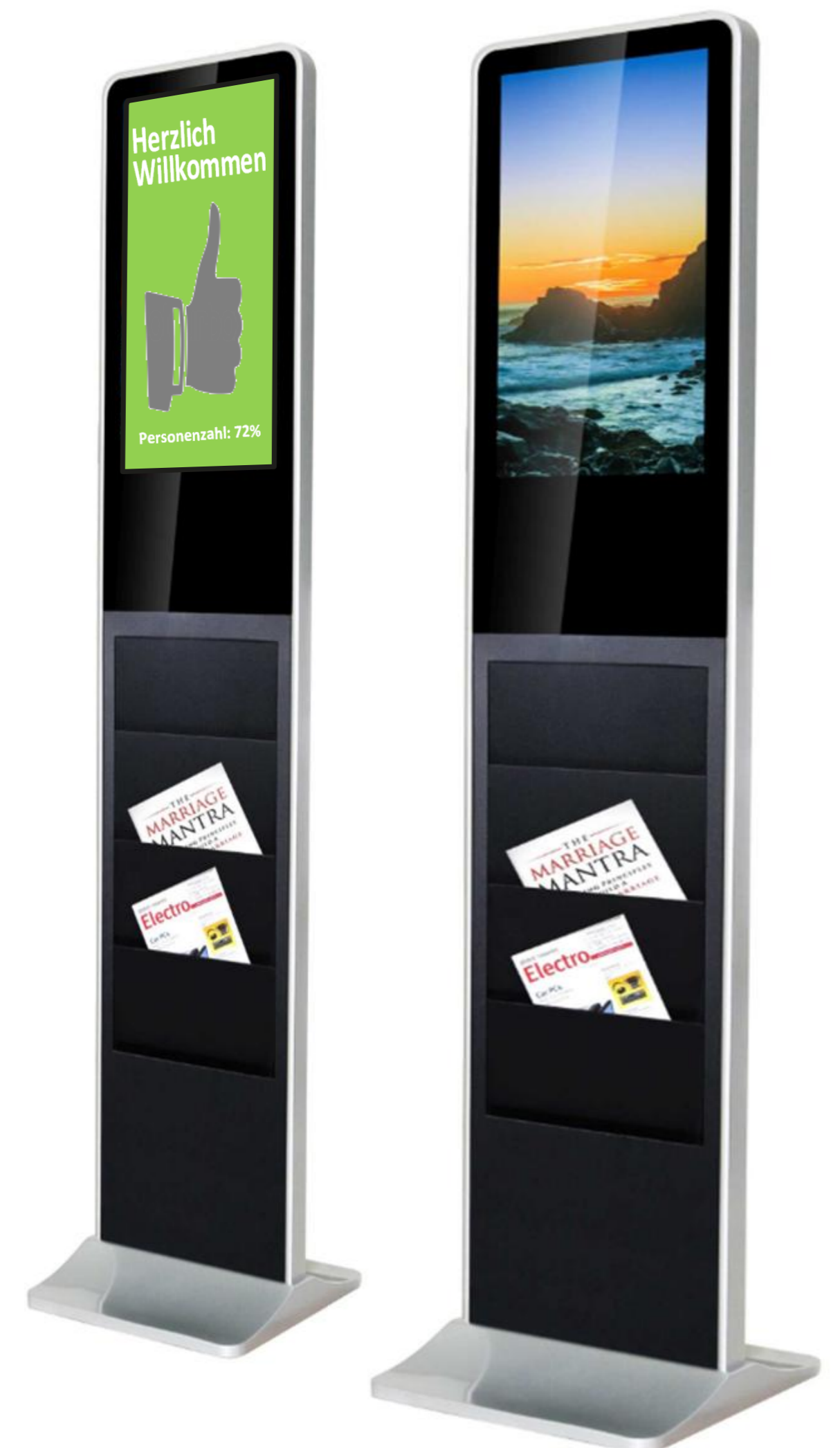
Digital Signage Stehle als Anzeigeterminal für das COVID-Besuchermanagement.

Die Kunden werden in Echtzeit informiert. Gleichzeitig werden alle Daten in der Besucherdatenbank erfasst. Der Datentransport erfolgt über Netzwerk oder WiFi.